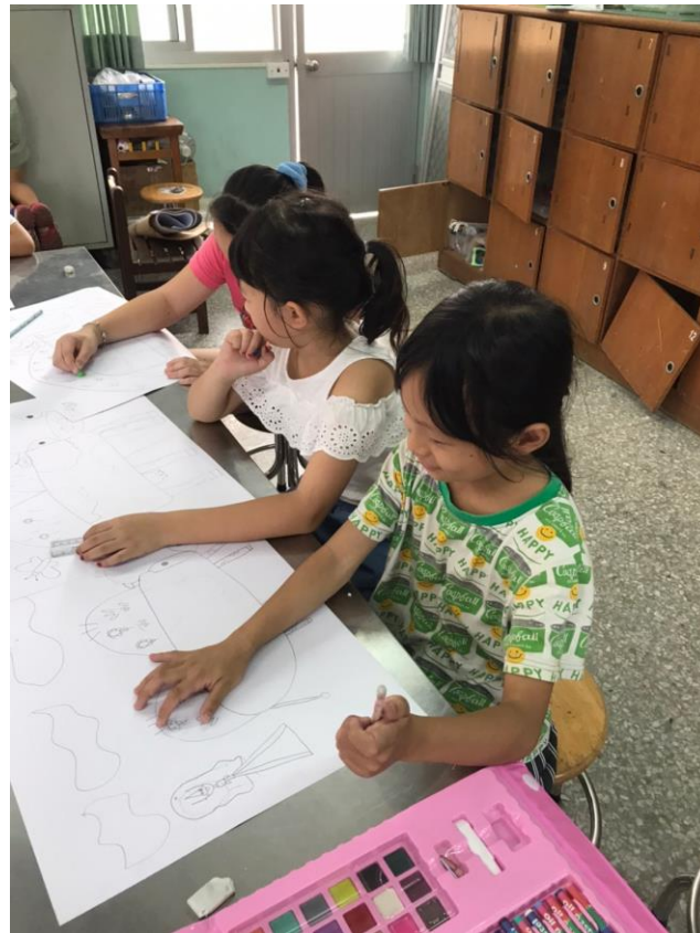
提供弱勢學生學習繪畫