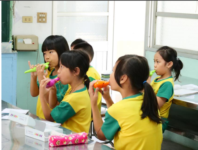
提供弱勢學生學習陶笛