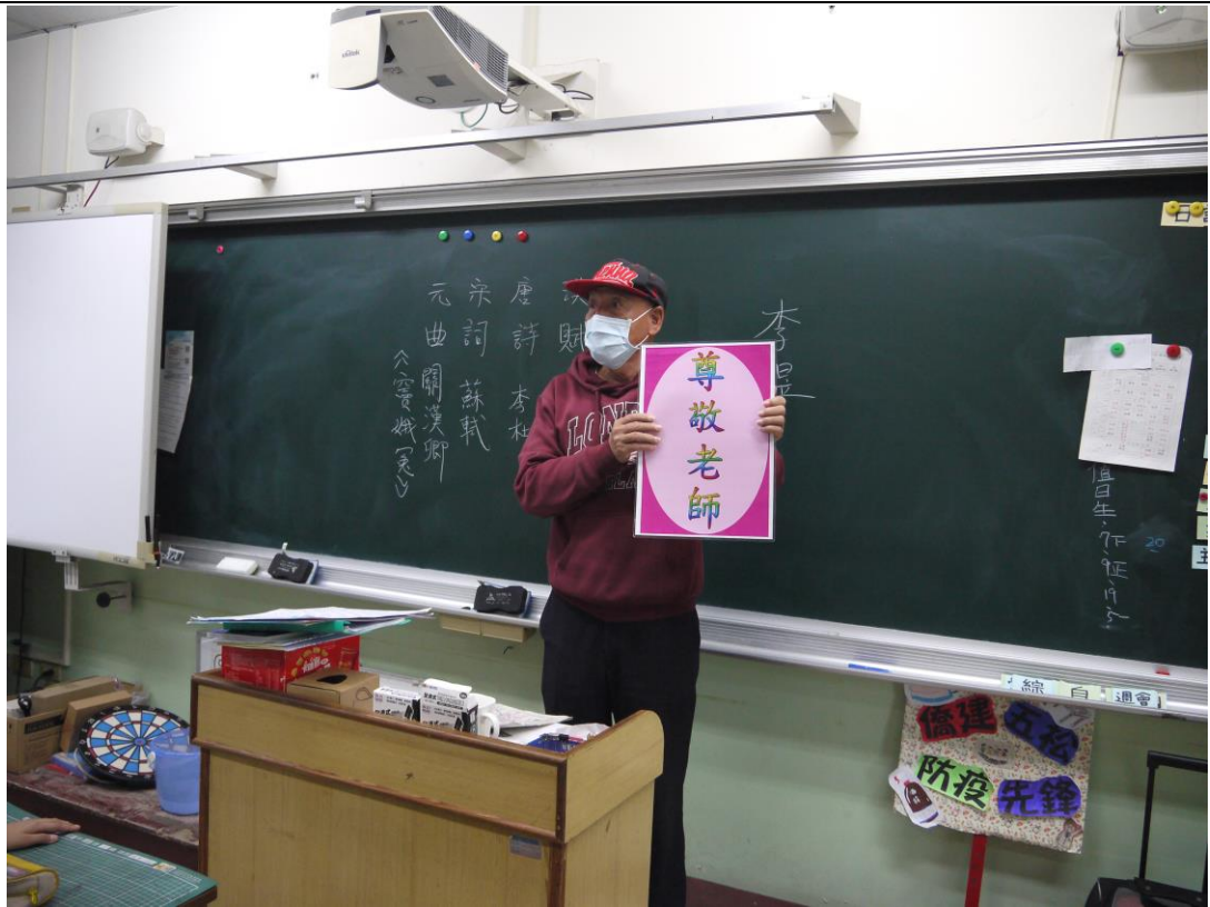
說明：全國孝行獎得主蒞校宣導