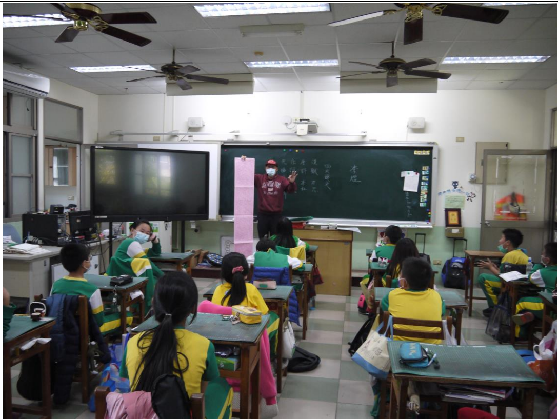
說明：全國孝行獎得主蒞校宣導