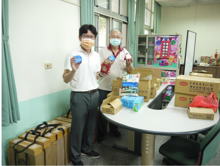
說明：華光功德會捐贈弱勢學童物資